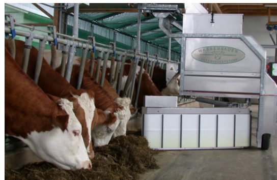
Wasserbauer Fütterungssysteme GesmbH: Bestes Futter serviert vom 'Butler' - Beste Informationen erzeugt von SelectLine.