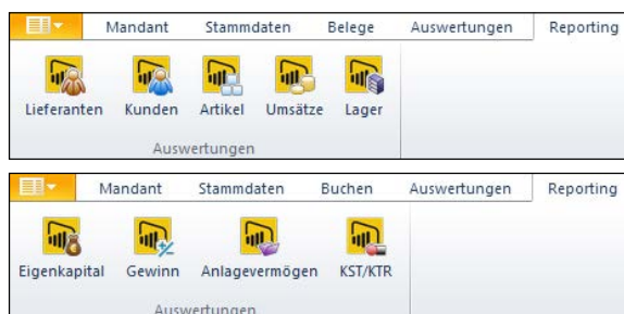
Ribbonbar mit SelectLine Reporting Auswertungen in Warenwirtschaft (oben) und Rechnungswesen (unten)

Der Begriff Business Intelligence (BI), bezeichnet Verfahren und Prozesse, die der systematischen Analyse von elektronischen Daten dienen. Business Intelligence Systeme stellen Ihre Unternehmensdaten visuell ansprechend dar und erleichtern erheblich deren Auswertungen und Interpretation. Auf Knopfdruck erhalten Sie aussagekräftige Auswertungen, damit Sie Zeit haben, die richtigen Erkenntnisse zu gewinnen.