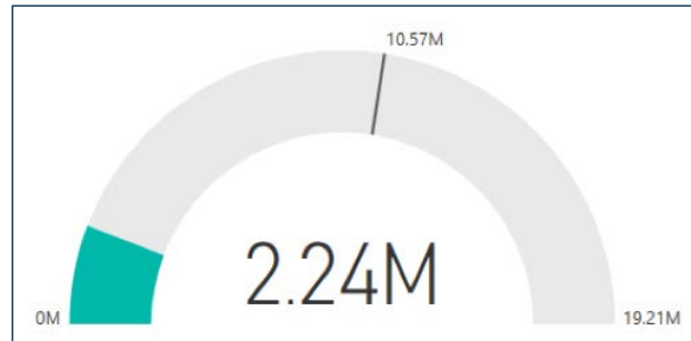
aktueller Umsatz, MaxUmsatz und Umsatzziel

Das Paket beinhaltet insgesamt 22 vorgefertigte Auswertungen, die direkt in den Programmen SelectLine Warenwirtschaft und SelectLine Rechnungswesen in der Ribbonbar aufrufbar sind. Für die einfache Erstellung Ihrer individuellen Auswertungen werden zusätzlich neue Views mitgeliefert, die die wichtigsten Daten bereits aufbereitet zur Verfügung stellen. Um die Auswertungen aufrufen und bearbeiten zu können, muss das Programm Microsoft Power BI Desktop® installiert sein.